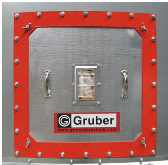
Einstiegs Luke mit Sichtfenster