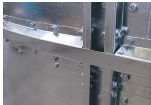
Versteifungsring und Ringverbinder