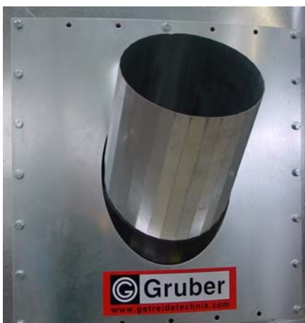
Schneckendurchführung inkl. Einschubrohr 300 Ø